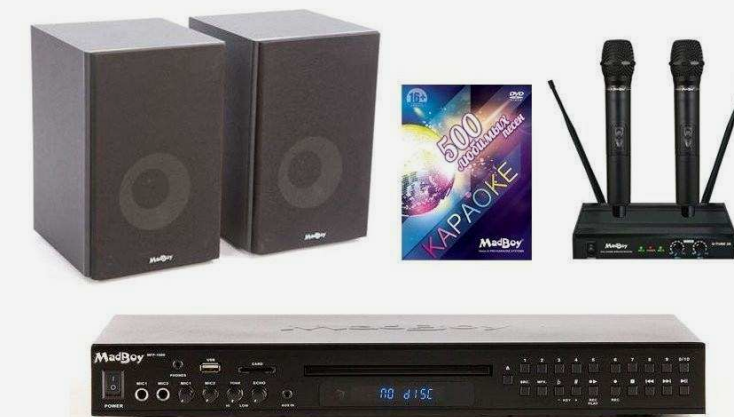
Комплекты караоке Цена по запросу