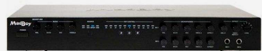
DVD-плееры караоке Цена по запросу