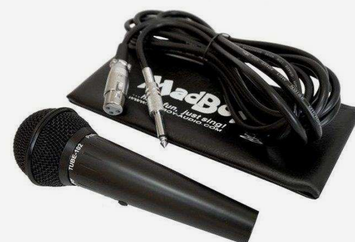
Микрофоны для караоке от 1 690 р.