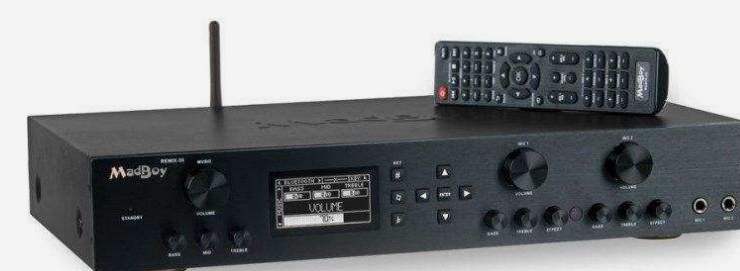
Микшеры и усилители для караоке от 34 900 р.

Подберем оборудование точно под задачу по этим характеристикам: