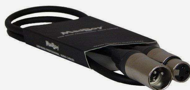
Кабели и коммутация для караоке от 1 690 р.