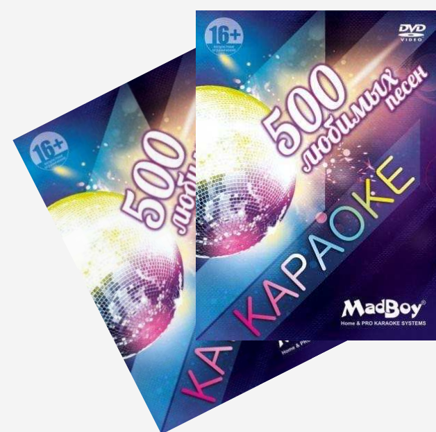
Диски для караоке Цена по запросу