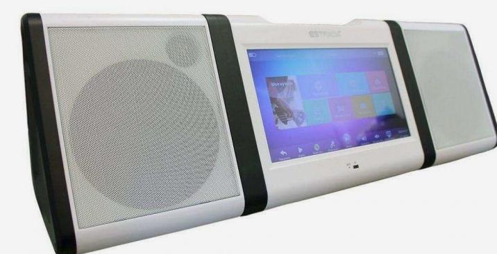
Караоке-центры Цена по запросу