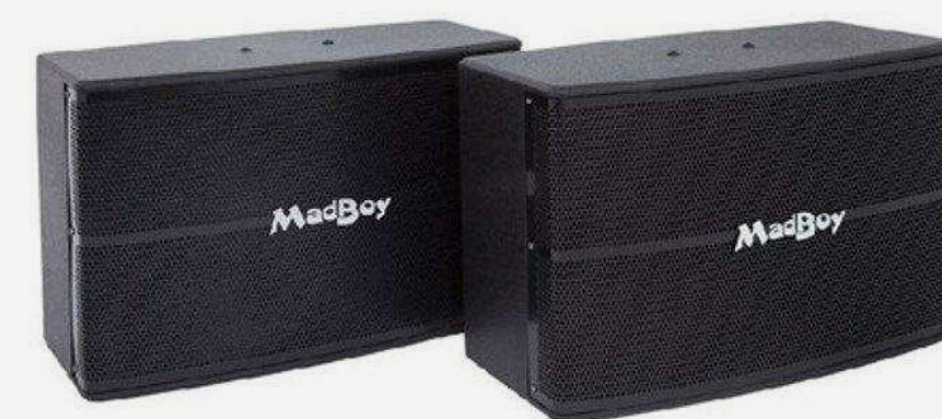
Акустические системы для караоке от 34 900 р.