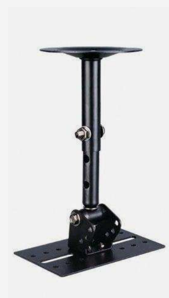
Аксессуары для караоке от 990 р.