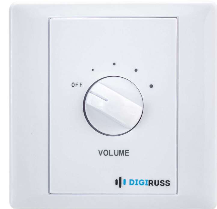
DIGIRUSS от 1 575 р.