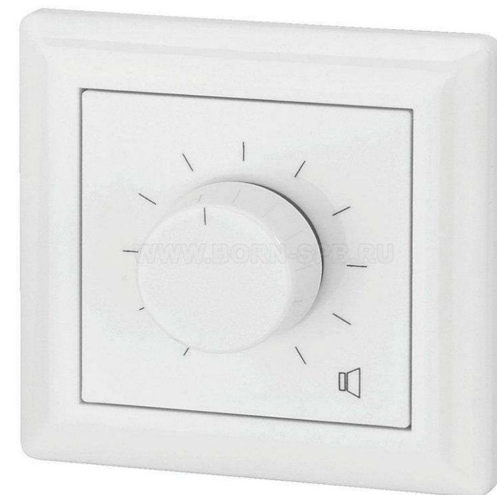
ROXTON от 1 680 р.