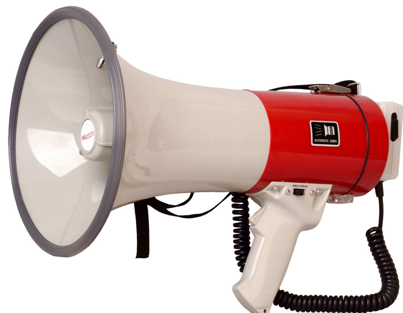
SVS AUDIOTECHNIK от 1 750 р.