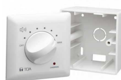
TOA от 970 р.