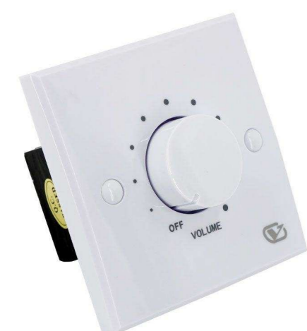
VOLTA от 294 р.