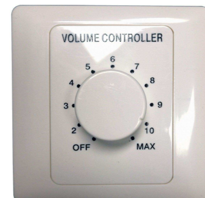
SVS AUDIOTECHNIK от 729 р.