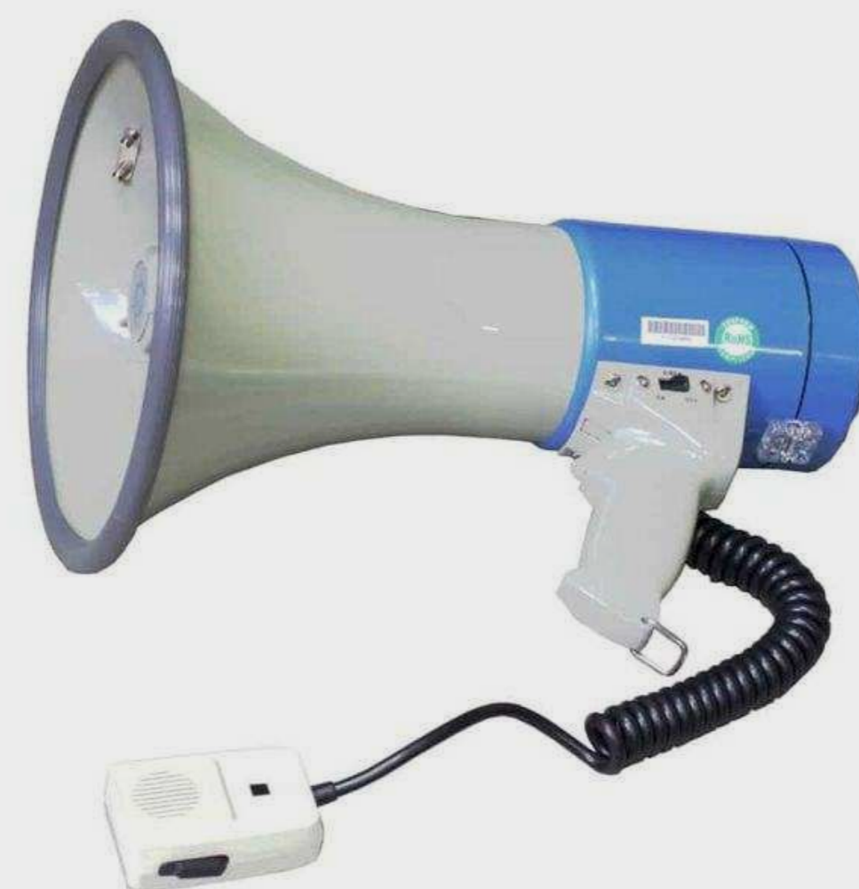
WORK от 8 107 р.

Подберем оборудование точно под задачу по этим характеристикам: