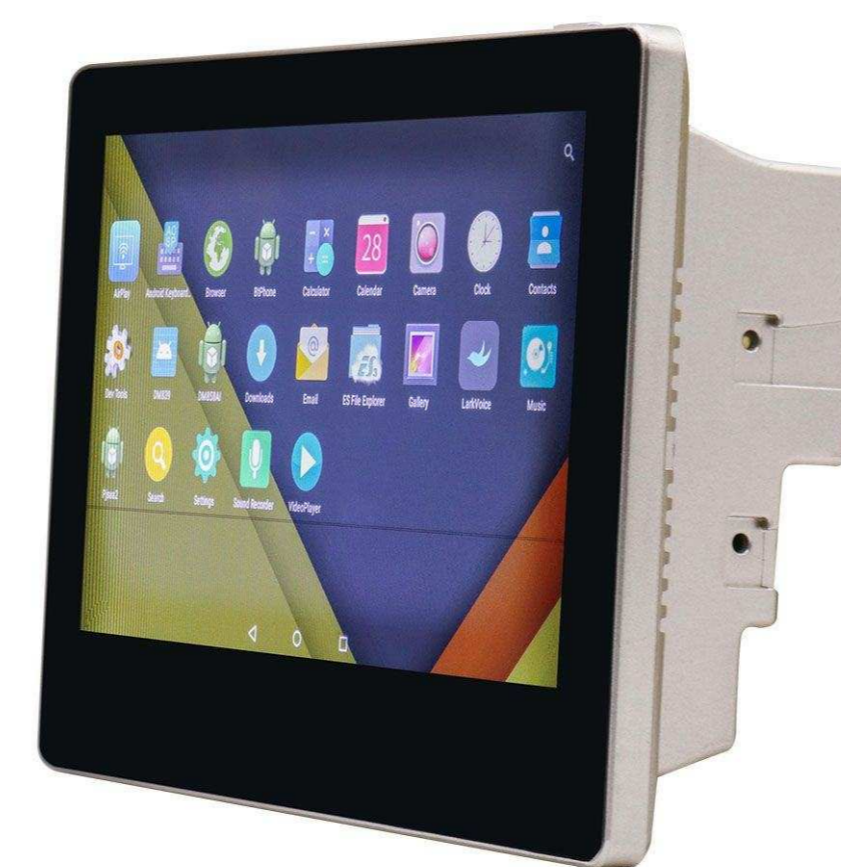
DSPPA от 11 385 р.

Подберем оборудование точно под задачу по этим характеристикам: