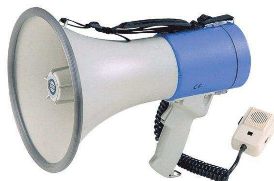
SHOW от 7 428 р.