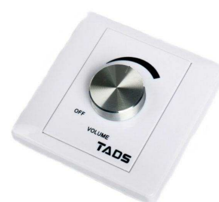
TADS от 420 р.