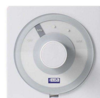
PROAUDIO от 1184 р.