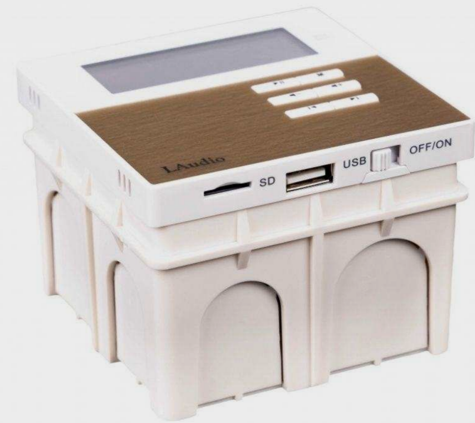
LAUDIO от 5 220 р.