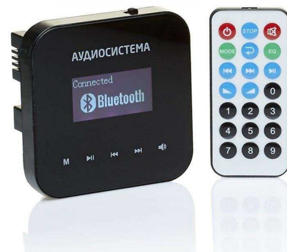
PASYSTEM (PAS) от 10 126 р.