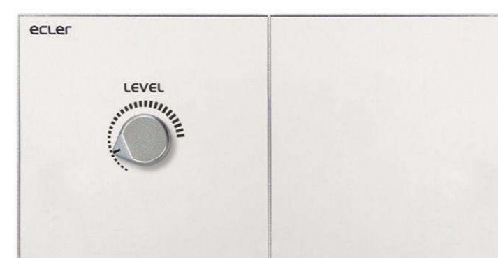
ECLER от 14 125 р.

Подберем оборудование точно под задачу по этим характеристикам: