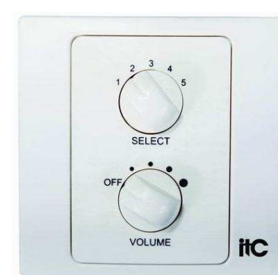
ITC ESCORT от 270 р.