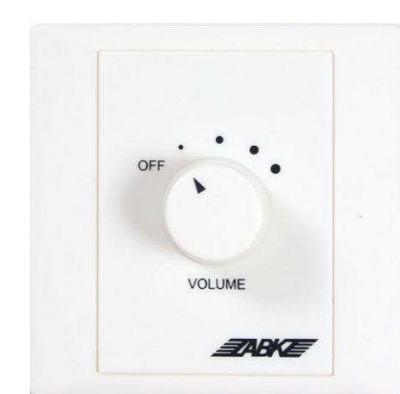
ABK от 234 р.