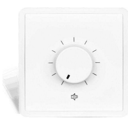
AUDAC от 1349 р.

Подберем оборудование точно под задачу по этим характеристикам: