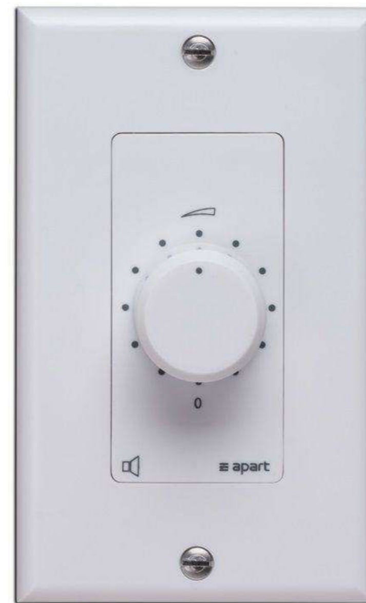
APART от 4 485 р.