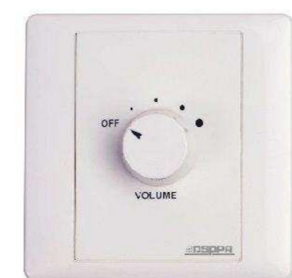
DSPPA от 973 р.