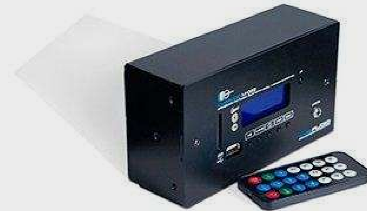
CVGAUDIO от 6 811 р.