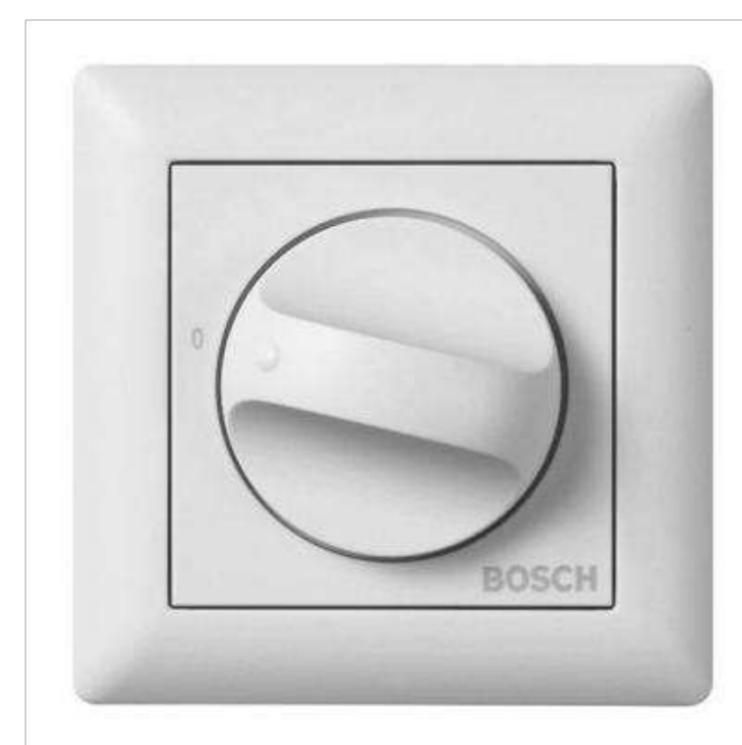
BOSCH от 3 400 р.