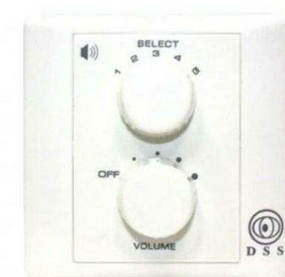
DSS от 690 р.