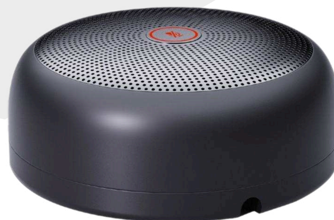
Дополнительные микрофоны для видеосаундбара от 18 300 р.

Подберем оборудование точно под задачу по этим характеристикам: