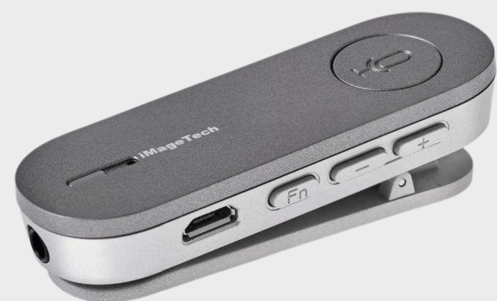
Петличные микрофоны от 35 900 р.