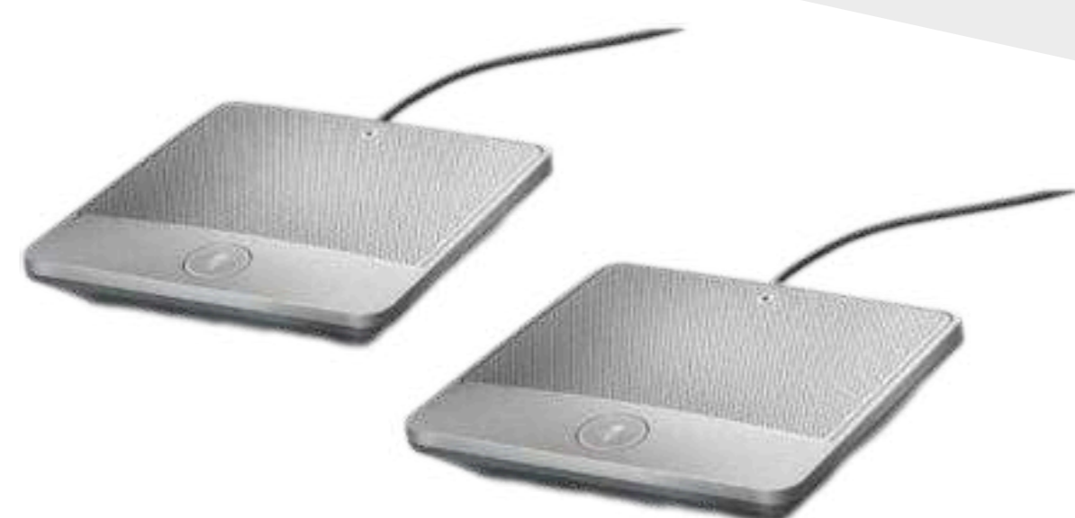
Дополнительные микрофоны для увеличения радиуса захвата звука от 9 100 р.