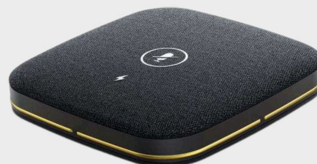
Беспроводные микрофоны для ввода звука Цена по запросу